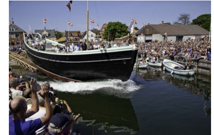
"Bonavista" rammer vandet.

Hvis i har mulighed og interesse for det, kan man gå på Youtube, søge på "Bonavista, Marstal og søsætning", der er et 2 min lang video klip af søsætningen.