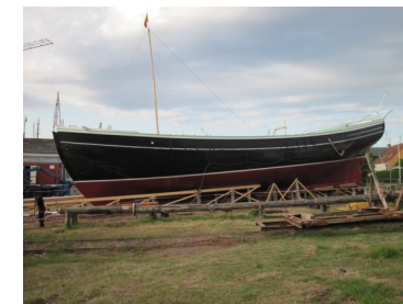
"Bonavista" inden søsætningen .

"Bonavista" som skulle søsættes om lørdagen.