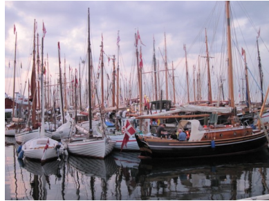
Træskibe side og side, der var omkring 100 stk. i alle størrelser.

søndag morgen at hans bud var mellem 750 og 800 lyst og motorbåde plus træskibene, hvilket han mente var rekord i Marstal havn.