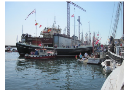
"Bonavista" flyder i havnen.

Hun gled flot videre ud i havnen, hvorefter en slæbe båd så sørgede for hun blev skubbet til kaj.